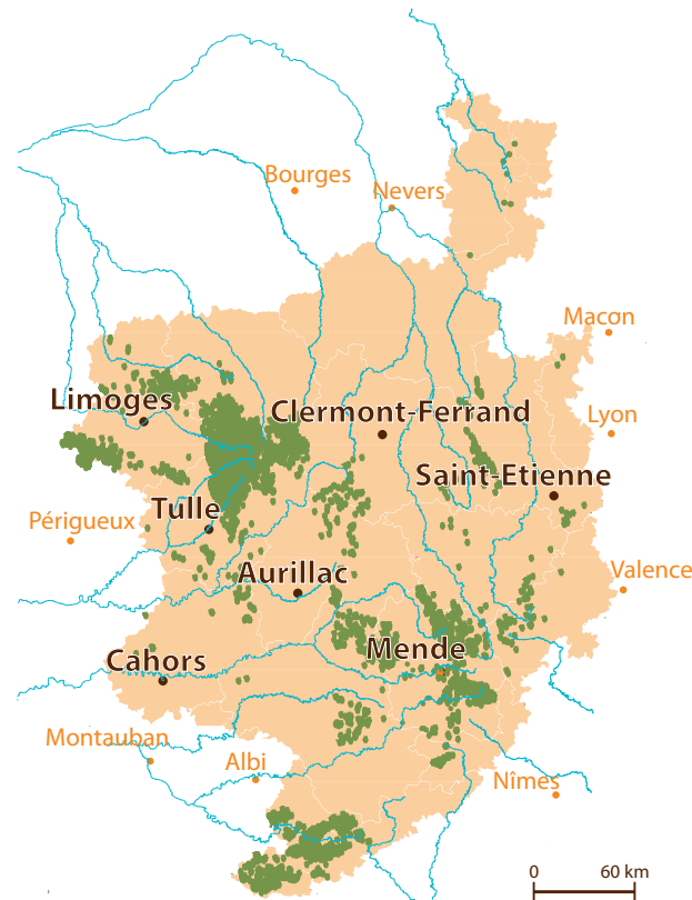
Les principaux secteurs de tourbières du Massif central.

Connaissez-vous les zones humides, Nos mal-aimées?