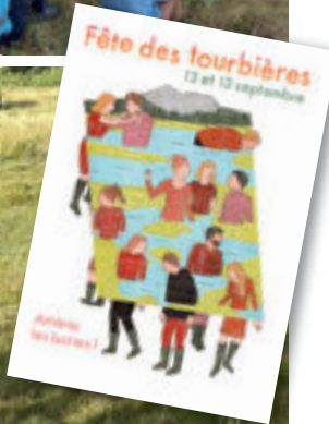
La fête des tourbières a été initiée en 2017 et se perpétue chaque automne sur la Montagne ardéchoise.